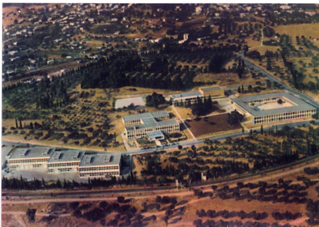
Αεροφωτογραφία της ΣΕΛΕΤΕ – Κτήμα Μακρυκώστα

διατάξεων» τα ανωτέρω επαναδιατυπώνονται με την επισήμανση του άρθρου 10 ότι ελλείπει πτυχιούχων της ΣΕΛΕΤΕ ή έχοντων συναφείς σπουδές στην αλλοδαπή διορίζονται στις ως άνω θέσεις οι έχοντες τα λοιπά κατά περίπτωση προσόντα, «υποχρεούμενοι, όπως εντός τριετίας εκπαιδευθώσι εις την Σ.Ε.Α.Ε.Τ.Ε.». Στο άρθρο 14 του ανωτέρω Ν.Δ. ορίζεται ότι το εκπαιδευτικό και βοηθητικό εργαστηριακό προσωπικό «εκπαιδεύεται και μετεκπαιδεύεται υποχρεωτικώς μεν εις την Σ.Ε.Α.Ε.Τ.Ε., προαιρετικώς δε εις Σχολάς της αλλοδαπής, χορηγουμένης προς τούτο αδείας μετ' αποδοχών», οι δε εκάστοτε επιλεγόμενοι «προς εκπαίδευσιν και μετεκπαίδευσιν εις την Σ.Ε.Α.Ε.Τ.Ε. ή την αλλοδαπήν ορίζονται διά αποφάσεων του Υπουργού Εθνικής Παιδείας Θρησκευμάτων μετά πρότασιν Κ.Σ.Ε.Ε.». Στο άρθρο 22 του ανωτέρω Ν.Δ. ορίζεται επίσης ότι όσοι έχουν πτυχίο ΣΕΛΕΤΕ ή αμέσως μόλις το αποκτήσουν μετατάσσονται στον αμέσως επόμενο βαθμό.